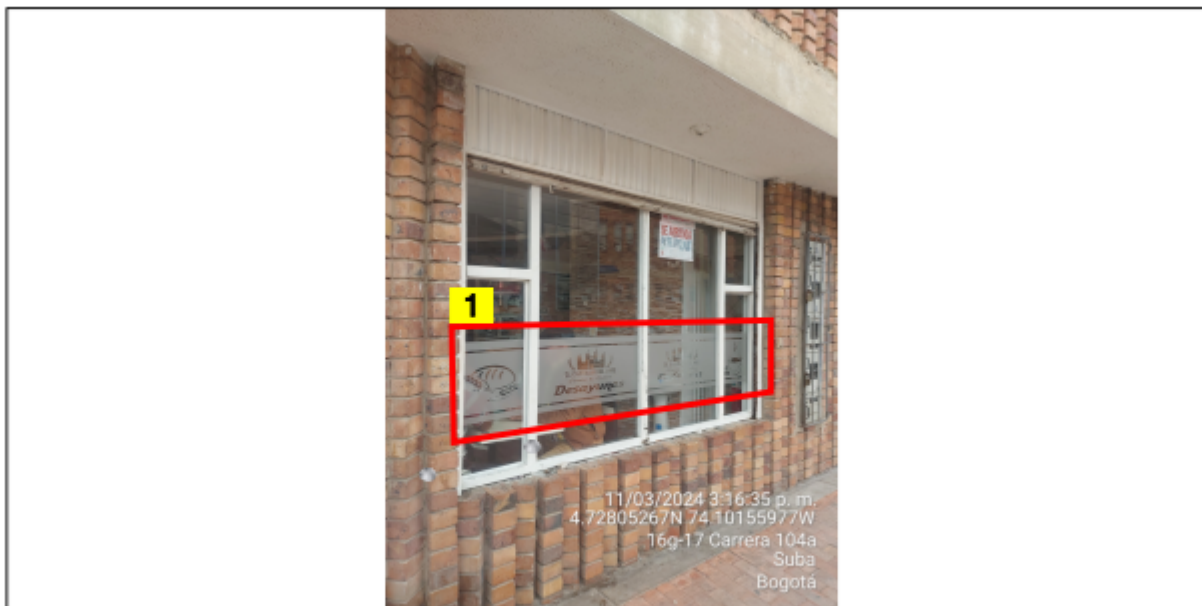
Vista panorámica de la fachada del establecimiento comercial que da sobre la calle denominado EL CASTILLO DEL PAN sobre la calle, en la que se puede evidenciar: un (1) elemento publicitario ubicado en las ventanas de la edificación, identificado con el número 1.